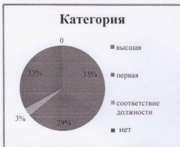
Диаграмма с характеристиками кадрового состава МБДОУ «Детский сад № 112»

По итогам 2023 года МБДОУ «Детский сад № 112» перешел на применение профессиональных стандартов. Из 35 педагогических работников все соответствуют квалификационным требованиям профстандарта «Педагог». Их должностные инструкции соответствуют трудовым функциям, установленным профстандартом «Педагог».